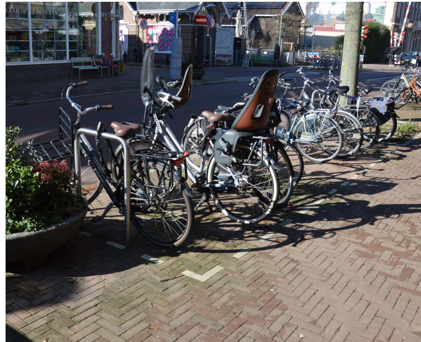
Fietsparkeren in de straat in een duidelijk vak. Fietsnietjes worden wat verder van elkaar afgeplaatst zodat ook bakfietsen of andere voertuigen hiertussen kunnen worden geplaatst.