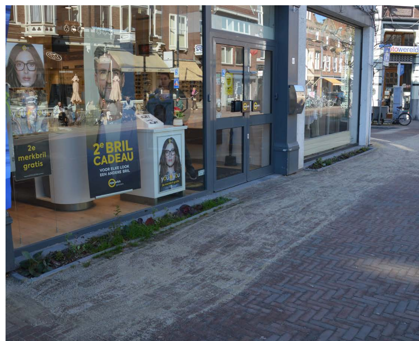
De gijsbrecht krijgt groenvakken gecombineerd met zitjes om optimaal gebruik te maken van de ruimte. In de groenvakken komt beplanting die de ecologie van de straat bevordert.