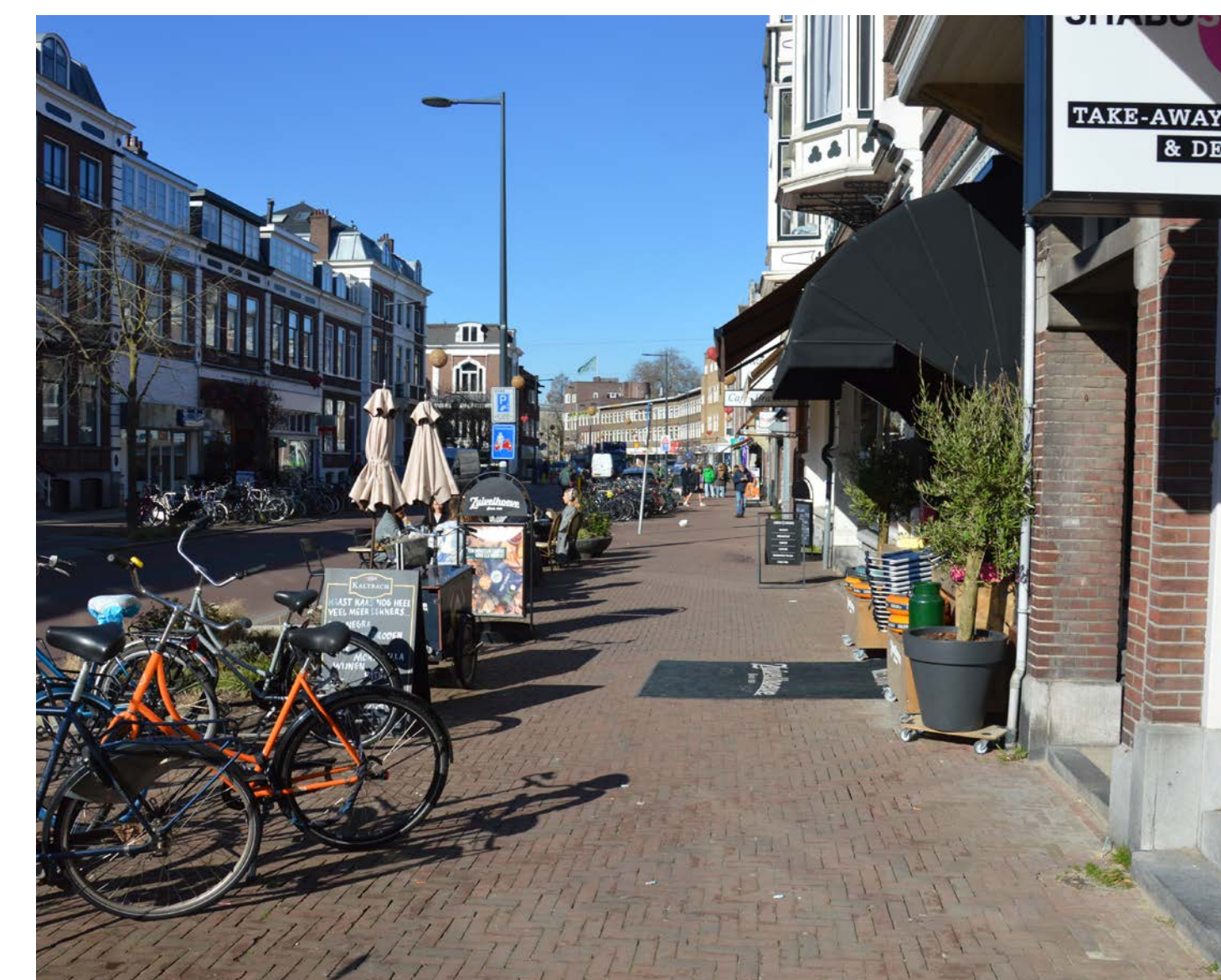
Uitstalling tegen de gevel zorgt nu voor een onvoldoende vrije loopruimte. Door de uitstalling van de gevel af te plaatsen, ontstaat een rustiger beeld en wordt de toegankelijkheid voor slechtzienden verbeterd.