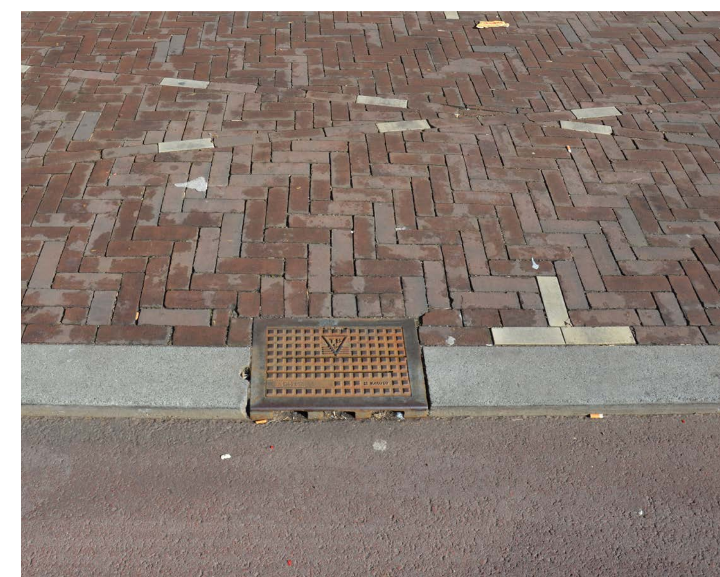
Parkeerplaatsen krijgen goedbruikbare afmetingen en bevinden zich op de hoogte van het trottoir.

De bovenstaande beelden zijn referenties voor het organiseren van de verschillende elementen die een plekje moeten vinden in de straat. Materialisering wordt in het verlopig ontwerp onderzocht.