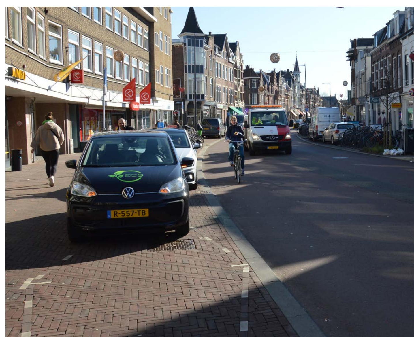
Laad- en losplekken worden gecreeerd om ontstopping en gevaarlijke situaties op de rijweg te voorkomen. Buiten de venstertijden kan de plek een andere functie hebben.