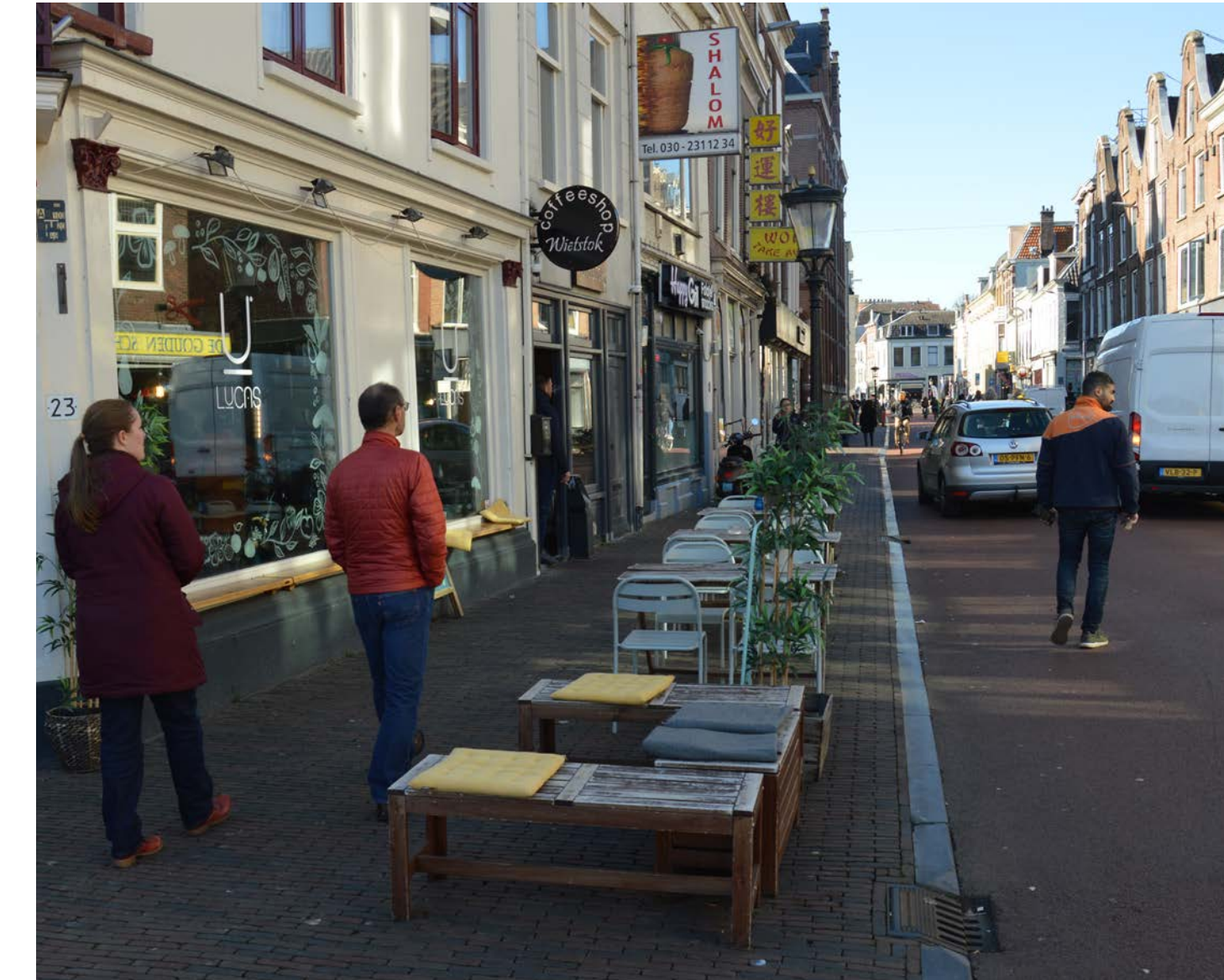
Terrasruimte in de Gijsbrecht wordt aangegeven door duidelijke vakken te creëren dichtbij horecagelegenheden.